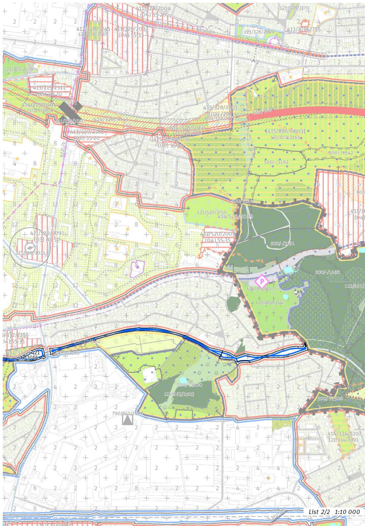
List 2/2 1:10 000