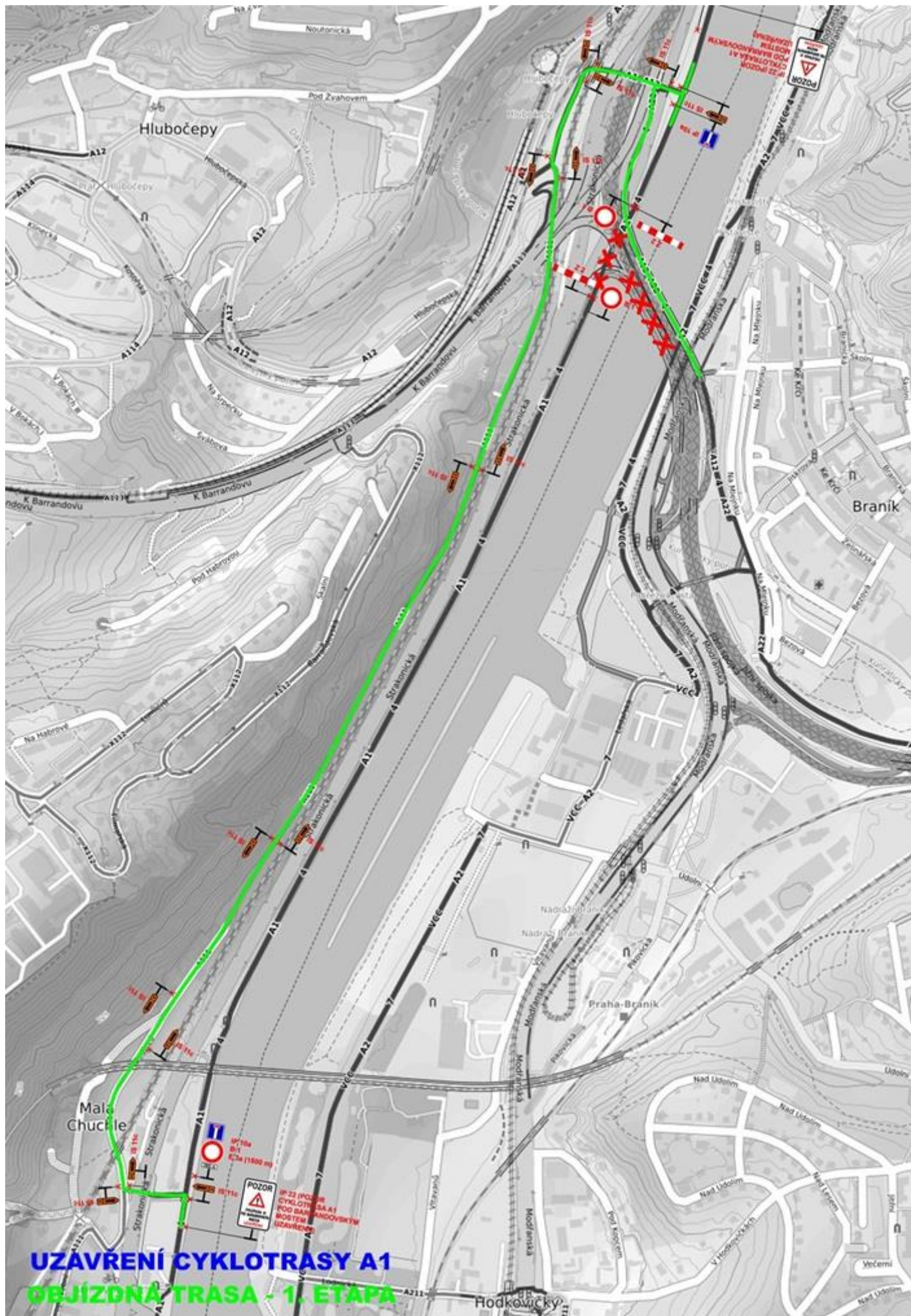
UZAVŘENÍ CYKLOTRASY A1 OBJÍZDNÁ TRASA - 1. ETAPA