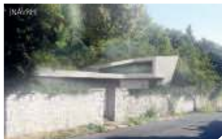
Podoba rodinného domu, již schválila radnice Prahy 5. Obrázek vpravo ukazuje fiktivní grafiku studia Space 8, která nemá s realitou nic společného

V podkladech výboru i rady došlo k vysvětlitelné administrativní chybě, kdy číslo parcelní bylo v žádosti majitelů původně zapísáno „p. č.“ a chybou při přípravě dokumentů bylo zaměněno za „č. p.“ – tedy za číslo popisné. Jako parcelní číslo pozemku se pak objevilo neexistující číslo 1832. Jde o pochybení bez jakéhokoli špatného úmyslu a za toto