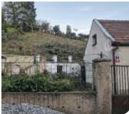
Tento svah byl ještě nedávno plný vzrostlých stromů

Primárně bylo potřeba zjistit, zda byl takový čin protiprávní. „Stav smrku byl kontrolou 20. dubna označen jako havarijní a podle zákona není v tomto případě nutné žádat o povolení kácení. Nicméně tímto oznámením od odboru životního prostředí