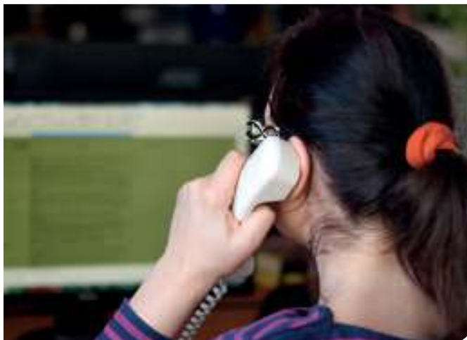
O pomoc můžete žádat každý všední den od 16 do 20 hodin

„Lidé se na krizovou službu nejčastěji obrací v situaci, kdy potřebují podporu, pomoc či radu. Cílem krizové služby je pomoci co nejlépe zvládnout náročnou životní situaci těm, kteří se na službu obrátí. Nejčastěji