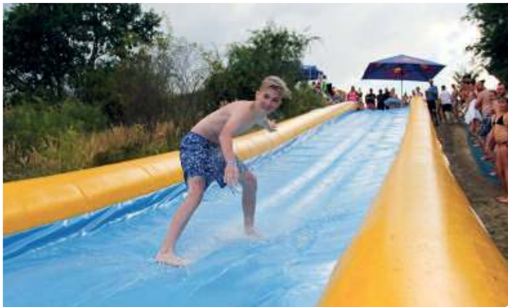
Asi největší atrakcí bude šedesátimetrová skluzavka