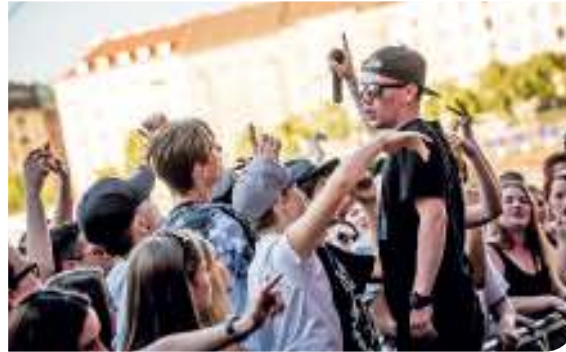
Loňský ročník si na náplavce nenechal ujít deset tisíc lidí

Ač začínal jako posluchač metalu a jednou z jeho nejoblíbenějších kapel