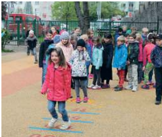
Školáci si novou plochu ihned vyzkoušeli

K dispozici tak jsou například skákací panák, bludiště, doskočiště pro skok do dálky či dva výškově nastavitelné basketbalové koše. Plocha každého herního prvku je probarvená. Bezpečnost dětí byla ovšem na prvním místě, a proto byl zvolen pryžový povrch hřiště, aby při případných pádech byl maximálně tlumen dopad a případná zranění pak byla minimální. Okolí hřiště nechala