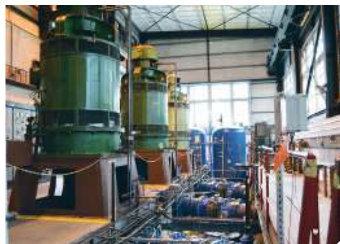
Vodu pohánějí tři čerpadla, každé o výkonu tisíc litrů za vteřinu

Věž navrhl Karel Hubáček, známý hlavně jako autor projektu televizního vysílače Ještěd