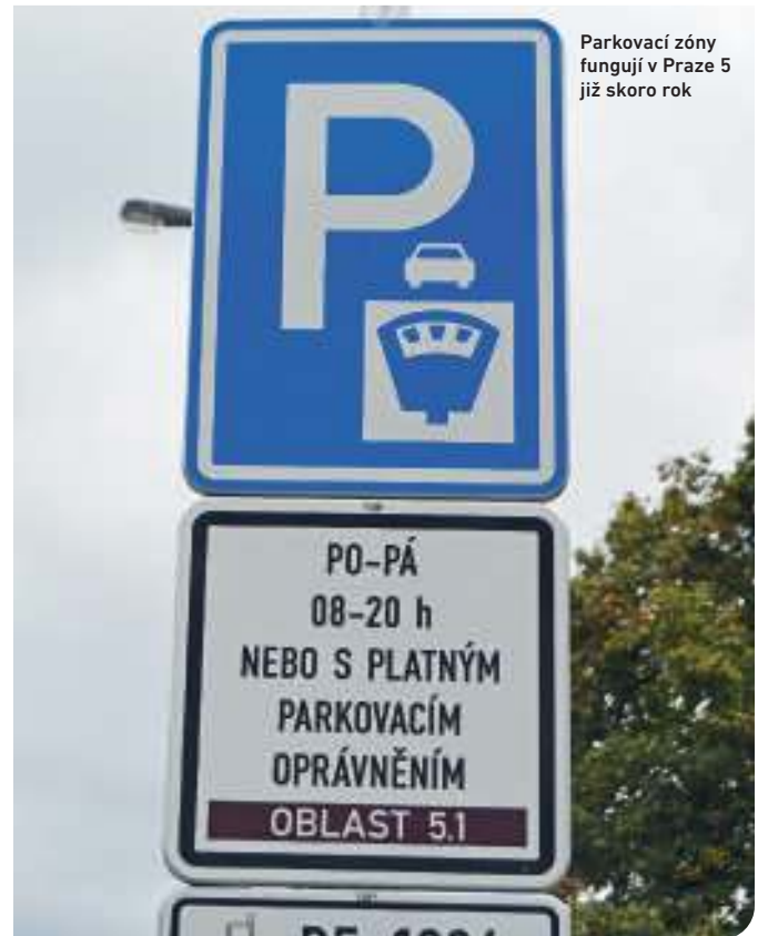
Parkovací zóny fungují v Praze 5 již skoro rok

V pátém obvodu byly zóny placeného stání zavedeny 24. srpna loňského roku. ■ tk