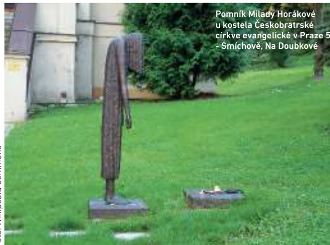
Pomník Milady Horákové u kostela Českobratrské církve evangelické v Praze 5 - Smíchově, Na Doubkově

V září 1949 byla zatčena ve své kanceláři v Masné ulici a od té doby prožívala kruté výslechové metody StB. Odpůrci režimu byli popraveni a stejný osud čekal i na Horákovou, která až do konce byla nezlomná a oddaná své věci. Justiční vraždu