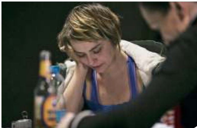
V divadelní nabídce nechybí inscenace Pohlavní životy siamských dvojčat

Filmová jízda začíná již 31. května, kdy můžete od 21.30 hodin dorazit na švédský film „My jsme nejlepší“ režiséra Lukase Moodysona, který byl natočen podle komiksových předloh. V červnu se promítá každou středu ve stejný čas a až do září se mezi kolejemi a dálnicemi představí šestnáct filmů. Na letních cestách se seznámíte s různými žánry a zastavíte se na odpočívadlech různých zemí. S Jarmuschem, Allenem, Formanem, Wajdou, bratry Coenovými nebo Bergmanem se dostanete do jiných světů, zatímco dálnice dávno utichne a vlaky už své cestující dovezou domů.