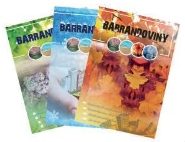
Barrandoviny vycházejí již dva roky také v tištěné verzi, a to na jaře a na podzim

Projekt www.barrandoviny.cz vznikl právě proto, aby se veřejnost lépe orientovala a byla informována o všem, co se koná na sídlišti Barrandov a v jeho okolí. „Především pak poskytuje neziskovým organizacím prostor, aby mohly zdarma prezento-