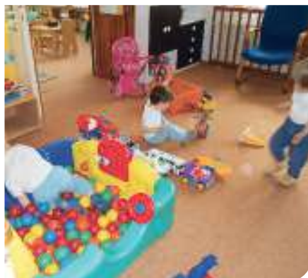
Na Hřebenkách děti najdou samozřejmě hračky, nechybí ale ani třeba jazyková výchova

Provozní doba je stanovena od 6.30 do 17 hodin, v čemž jesle vycházejí z požadavku rodičů a zákonných zástupců. Letošní rok mají i nově rozšířený prázdninový provoz. Od 14. do 25. srpna budou z důvodu čerpání dovolených zaměstnanců a provedení celkového úklidu a hygienických opatření jesle uzavřeny. Důraz se klade i na adaptaci dítěte. Před nástupem do jeslí je u některých dětí důležitá adaptace, kdy si dítě postupně zvyká na odloučení od rodiče a přijímá nový kolektiv. Adaptace probíhá tedy v tomto případě i s rodičem nebo zákonným zástupcem, postupně se však jeho přítomnost zkracuje. Tento proces je velmi důležitý pro získání důvěry dítěte v kolektiv.