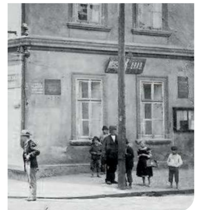
Budova košířské obecní školy před zbouráním počátkem 20. století