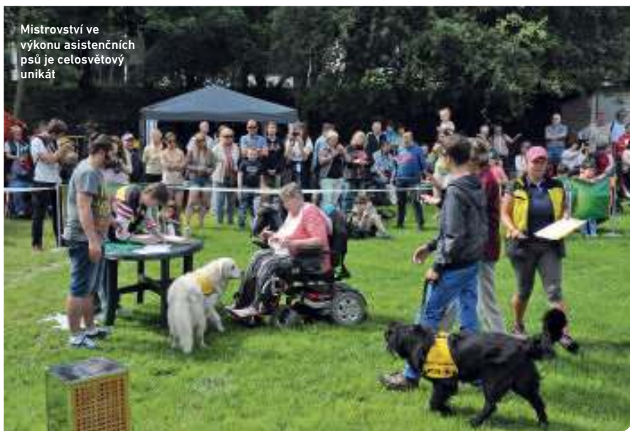
Mistrovství ve výkonu asistenčních psů je celosvětově unikát