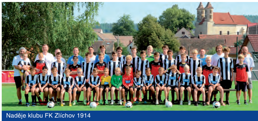
Naděje klubu FK Zlíchov 1914

posledních pěti let patří postup týmu žen do druhé nejvyšší soutěže republiky, dva postupy v řadě A týmu mužů a jeden postup B týmu mužů. V našem klubu pravidelně trénuje přes devadesát dětí z Prahy 5.