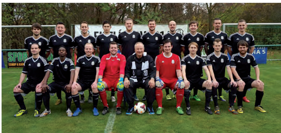
FK Zlíchov 1914 – tým mužů

Prozradte nám, kdy se začala psát historie klubu?