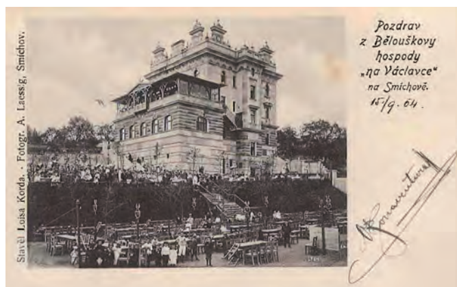
Původní podoba restaurace Na Václavce

Autor: Pavel Fabini, kronikář MČ Praha 5