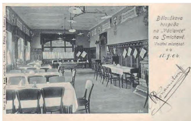
Interiér vily restaurace Na Václavce