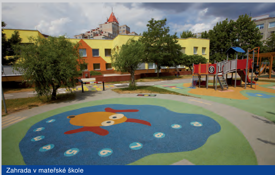
Zahrada v mateřské škole

Nedílnou součástí a důležitým prvkem je ranní a hodnotící kruh. Cílem kruhu je vést děti k tomu, aby si při vzájemném sdílení naslouchaly, aby se sezná-