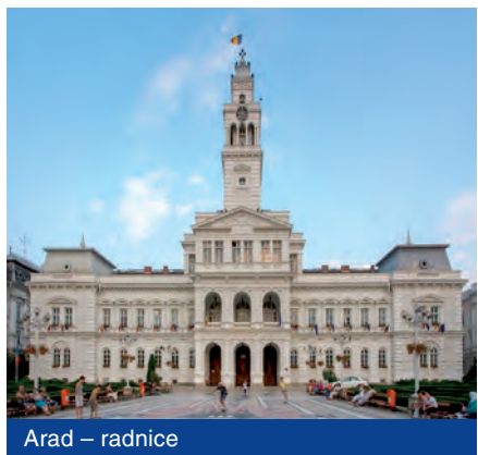
Arad – radnice

Zástupci naší městské části navštívili Arad na základě pozvání tamější municipality při příležitosti tradičních oslav „Dnů Aradu“. Kromě historického centra měli naši delegáti možnost prohlédnout si i oblíbené termální lázně Lipová a kostel sv. Marie, který slouží i jako poutní místo. V rámci městských oslav proběhla slavnostní ceremonie, během které se předávala čestná ocenění občanům z oblasti sportu, vědy, hudby, umění a školství.