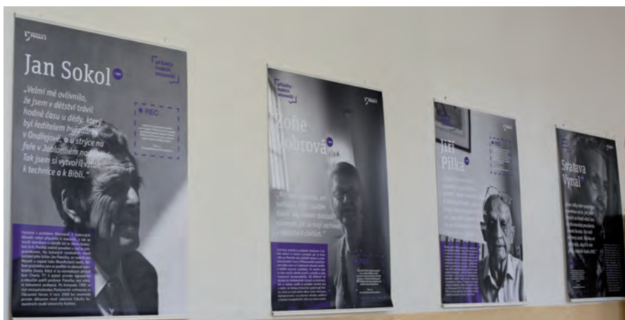
Putovní výstava Paměti národa