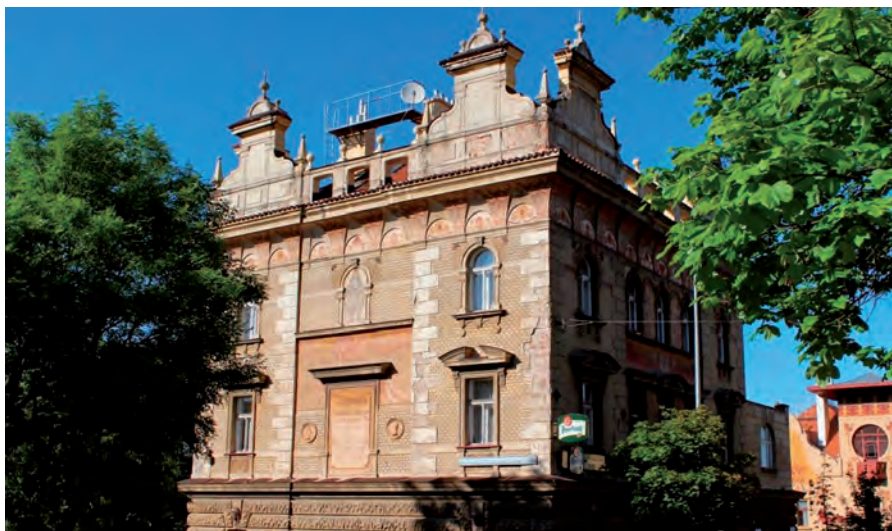
Vila Václavka dnes

První hosté mohli už v následujícím roce obdivovat panorama města Prahy z prostorné venkovní terasy a využít poklidnou atmosféru zahrady, umocněnou kontrastujícím pohledem na tékající průmyslové srdce Smíchova. Není divu, že se velmi záhy stala Václavka centrem zdejšího společenského života. Sama dynamicky se rozvíjející čtvrť zajišťovala dostatečnou návštěvnost, ale podnikavostí majitele se Václavka stala brzy vyhlášenou po celé Praze. Roku 1907 byl dokonce v jejích prostorách založen Český střelecký