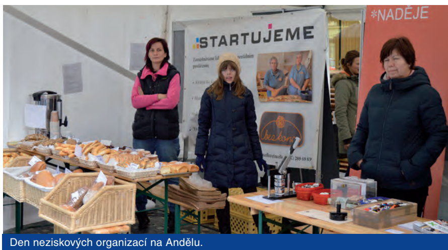
Den neziskových organizací na Andělu.

Autor: Antonín Homola, Oddělení občanské společnosti, podpory podnikání a zahraničních styků